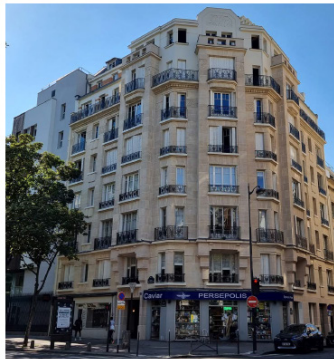
50, Av. de Versailles 75016 Paris