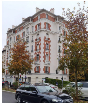
159, Av. du Gle Leclerc 92340 Bourg La Reine