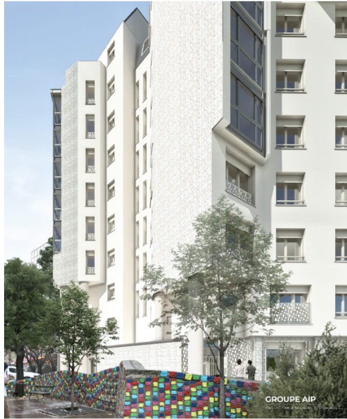
PRINCIPE DE RÉPARTITION - FAÇADES

Le contexte immédiat des deux immeubles COLIGNY et MONTIGNY est donc une architecture assez homogène relativement récente (années 70-80) dont les façades de certains bâtiments ont déjà fait peau neuve (l'auberge de jeunesse). Le projet de réhabilitation et d'isolation thermique extérieure offre la possibilité de qualifier, identifier l'adressage par des traitements différenciés des bâtiments dans l'îlot.