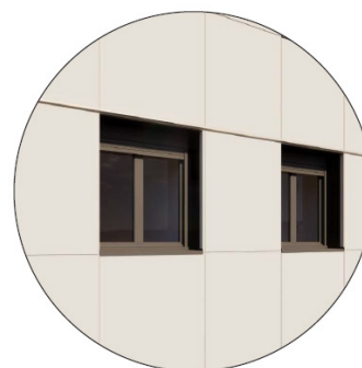
BARDAGE TRESPA GAMME UNI COLOURS TEINTE POPYRUS WHITE Encadrement de baie en aluminium RAL 7022