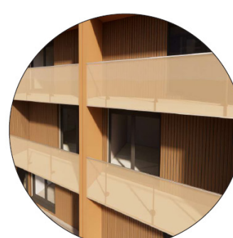
BARDAGE NEOLIFE COVER 6 TEINTE SUN Garde corps remplissage verre opalescent coloré RAL 1011