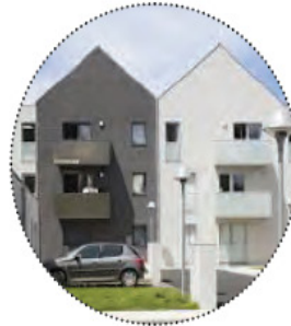
Création d'un rythme en façade