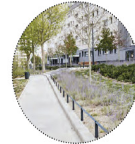
Lisse paysagère permettant d'intimiser des espaces